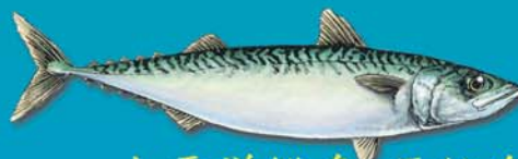
太平洋鱈魚 馬鮫魚